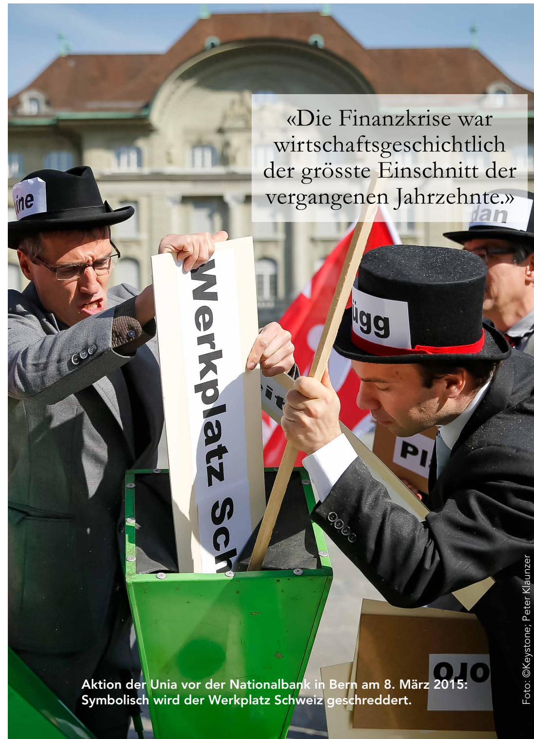
Aktion der Unia vor der Nationalbank in Bern am 8. März 2015: Symbolisch wird der Werkplatz Schweiz geschreddert.

den Exzessen des Shareholder-Value-Kapitalismus, welche zur Krise führten. Solche Exzesse gab es in der Schweiz ja auch. In den Neunzigerjahren mit den «Visionen» von Martin Ebner und Christoph Blocher: Sie postulierten für die Schweizer Wirtschaft die Vorgabe von 25 Prozent Eigenkapital-Rendite. Dazu kam Blochers Aufforderung, mit den AHV-Geldern an die Börse zu gehen. Blocher und Ebner haben damals Hallen gefüllt mit ihren Ideen, bei denen das treibende Moment hiess: «Alles läuft über die Börse!». Das war die Situation, als ich 1998 zum Präsidenten des Gewerkschaftsbundes SGB gewählt