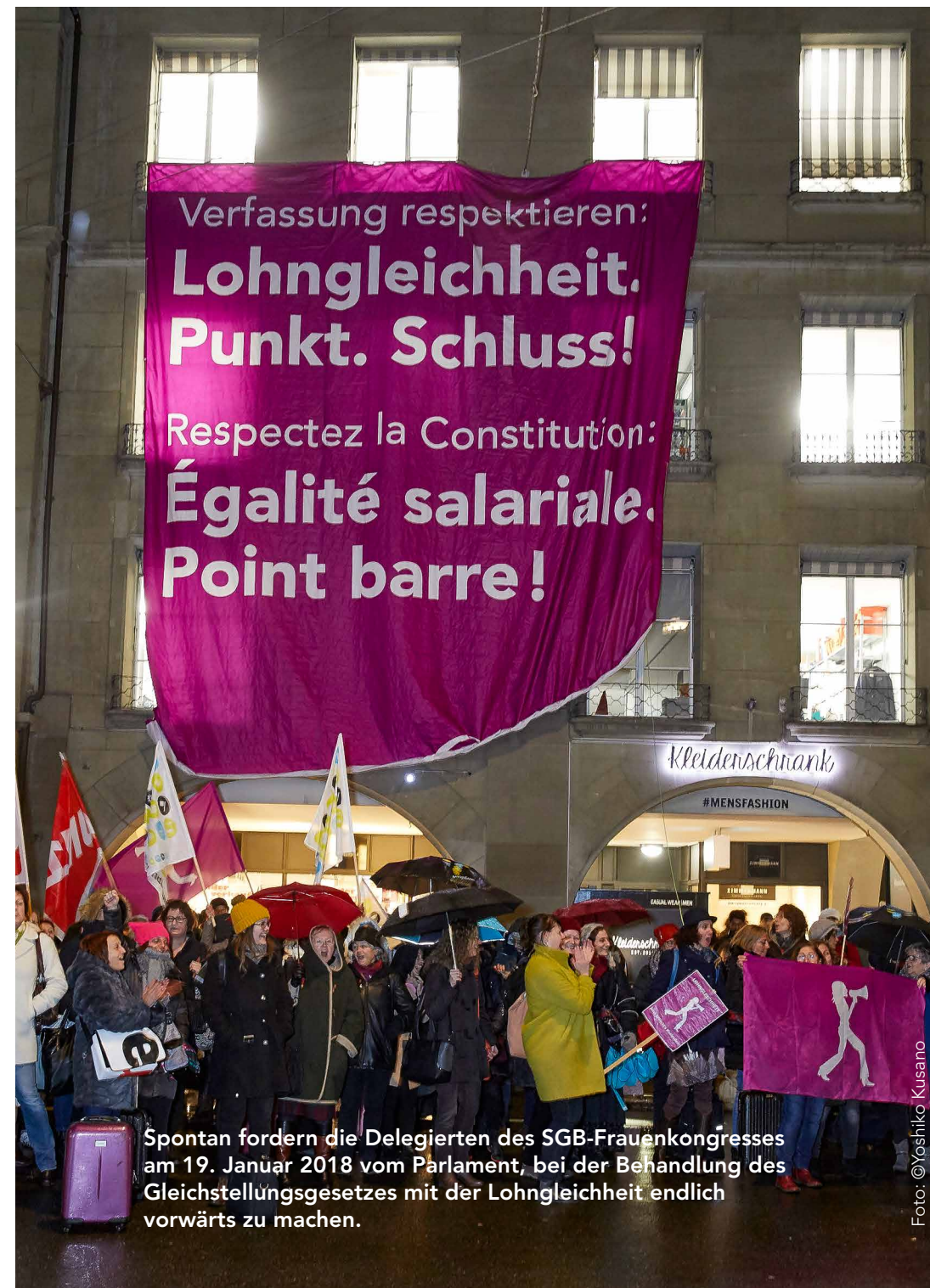
Spontan fordern die Delegierten des SGB-Frauenkongresses am 19. Januar 2018 vom Parlament, bei der Behandlung des Gleichstellungsgesetzes mit der Lohngleichheit endlich vorwärts zu machen.